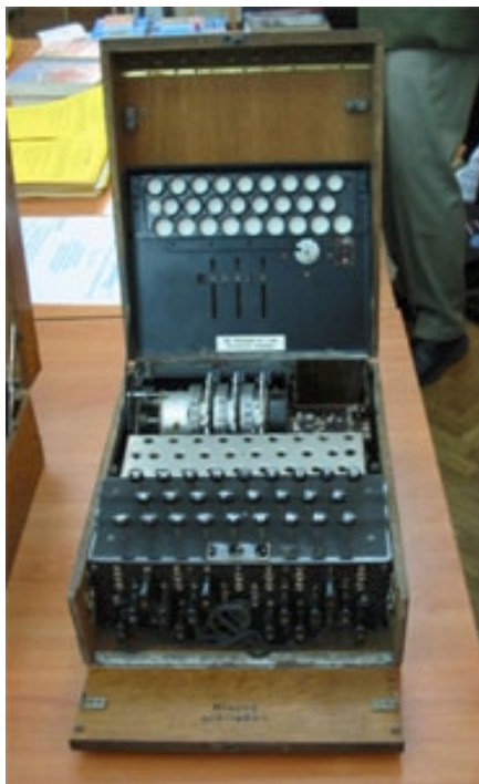
ENIGMA vystavená na konferenci Eurocrypt 2003

K problematice se ještě autor chce v Crypto-Worldu vrátit, každopádně doporučuji všem zájemcům o moderní pohledy v kryptografii (článek mj. obsahuje i obširnou bibliografii k problematice).